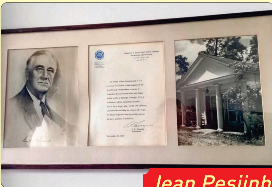
> Franklin D. Roosevelt stamde af van de Pilgrim Fathers