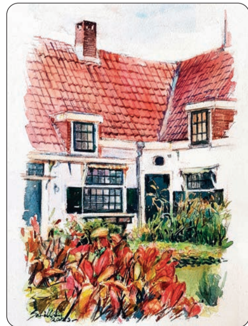
> Ter plekke gemaakt: links het schilderij van Antoon Erfteimeijer, rechts dat van Otto Schilling