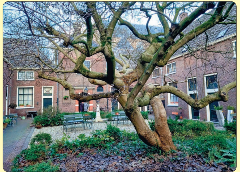
> De magnolia staat al honderd jaar in het hofje

Het Jean Pesijnhofje staat op historische grond. Waar nu het hofje is, woonden van 1611 tot 1620 twintig Engelse gezinnen die om geloofsredenen hun moederland waren ontvlucht. In 1683 verrees hier het Waalse hofje. De groep Engelsen emigreerde in 1620 met het schip de Mayflower naar Amerika. Dit is in de Ameri-