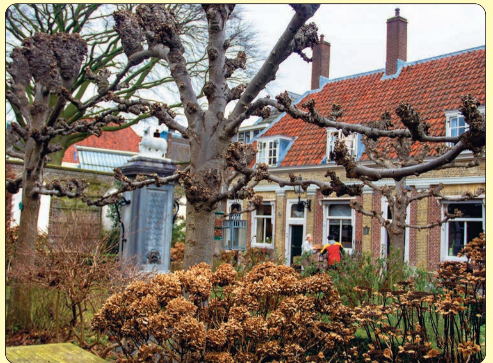
> De pomp is versierd met een natuurstenen schaap, dat ook voorkomt in het familiewapen. Acht lindes werden in 1739 geplant