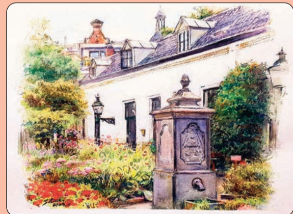
het voorportaal van het hofje, nu met cameratoezicht.